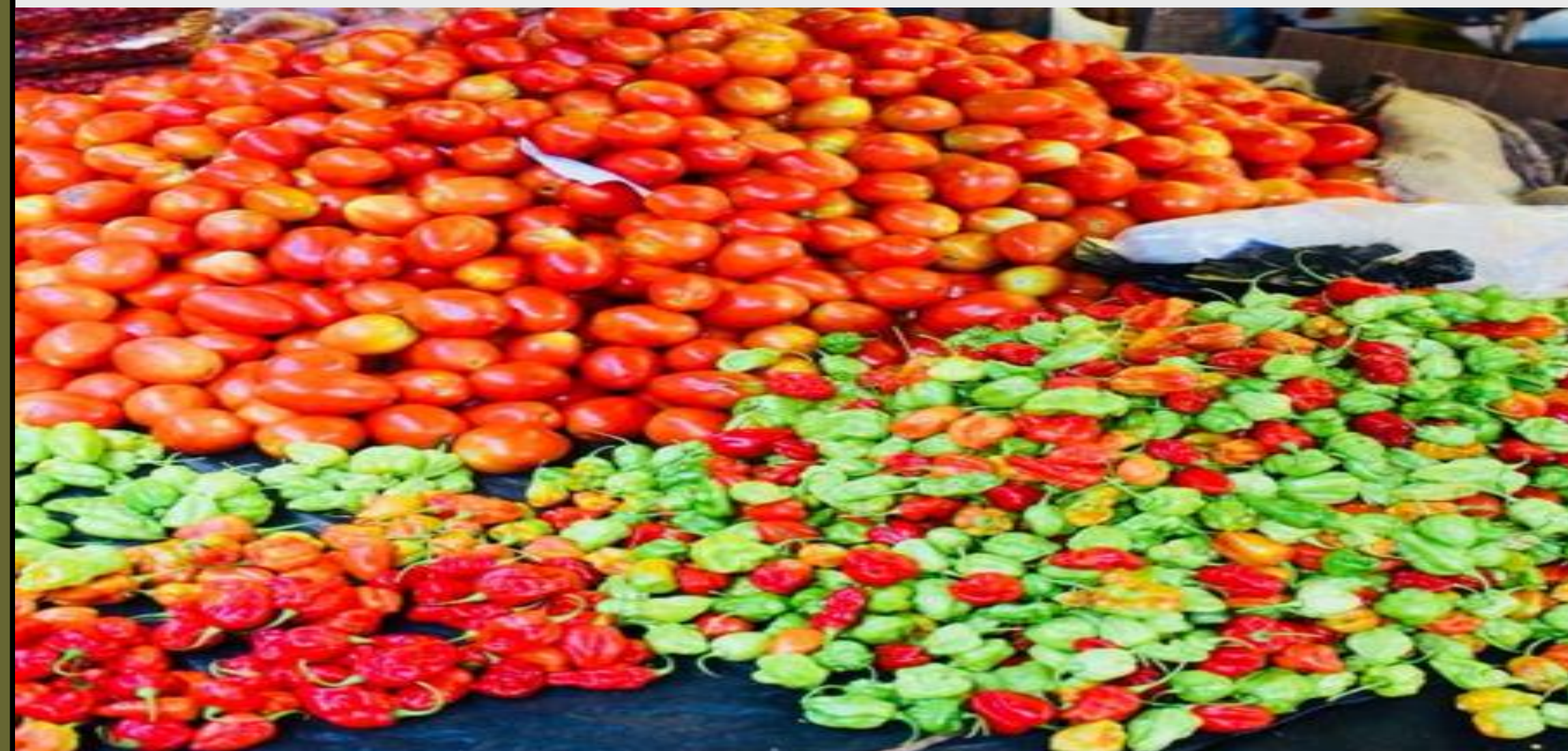
Tomate et piment/Tomato and pepper