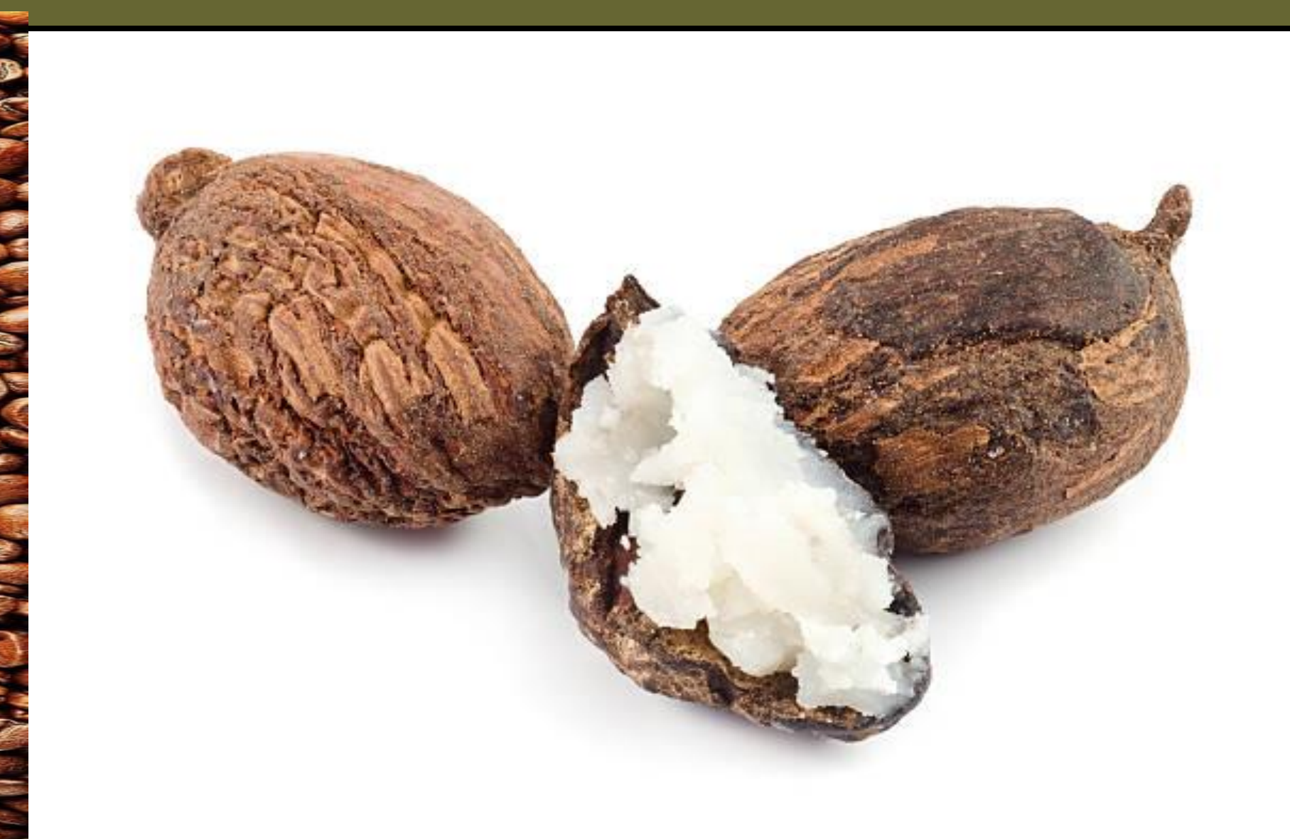
Beurre de karité/ Shea butter