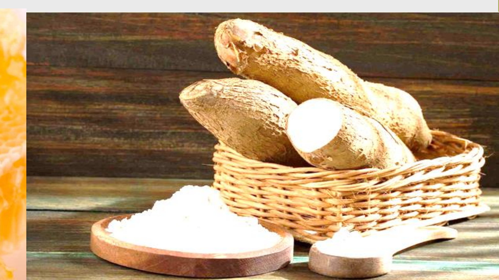
Farine panifiable de manioc/Cassava flour