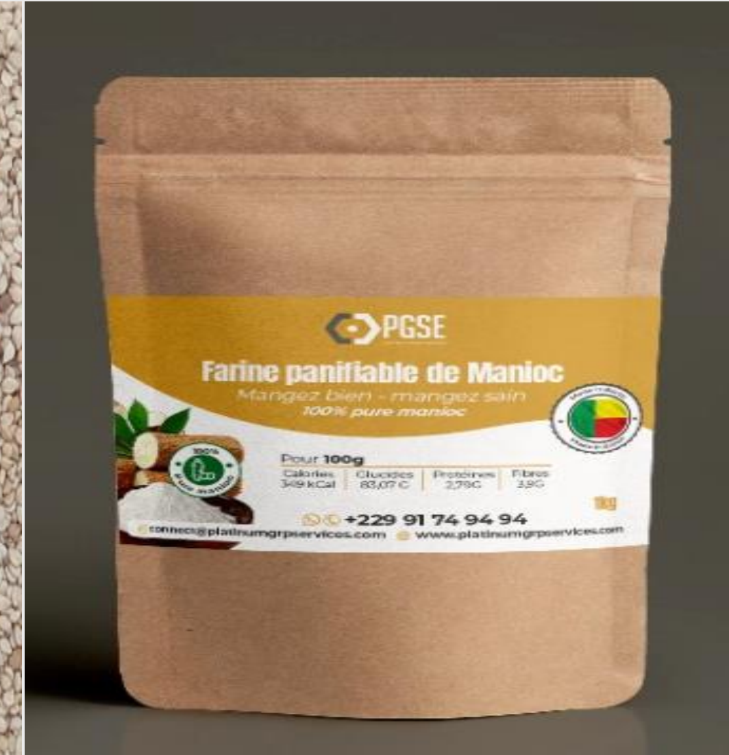
Farine de manioc/ cassava flour