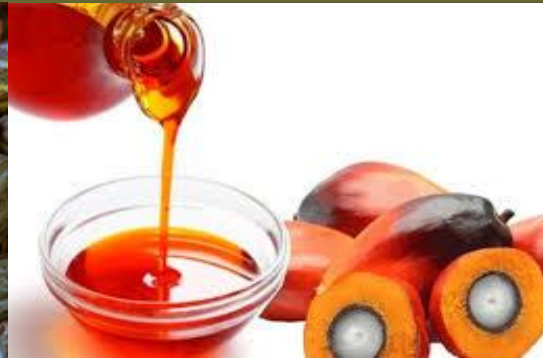
Huile de palme/Palm oil