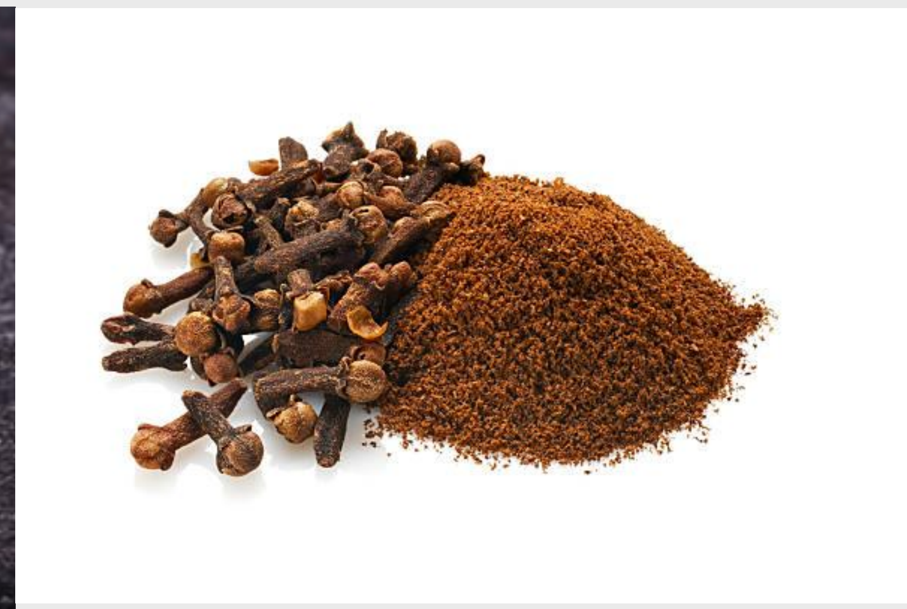
Clou de Girofle/Clove